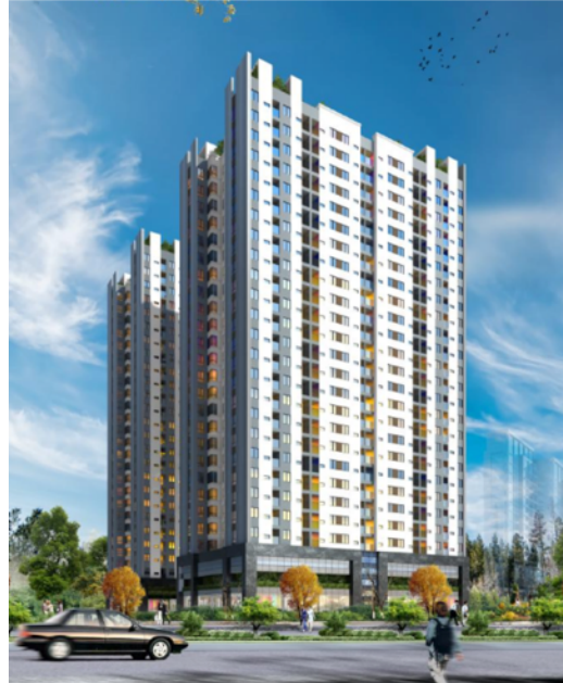
Phối cảnh cặp toà chung cư HH3, HH4

Đây là dự án cải tạo chung cư cũ trên địa bàn Thành phố, xây dựng chung cư HH3, HH4 tại Phường Đồng Quốc Bình, Quận Ngô Quyền, Hải Phòng thực hiện theo hình thức xây dựng - chuyển giao.