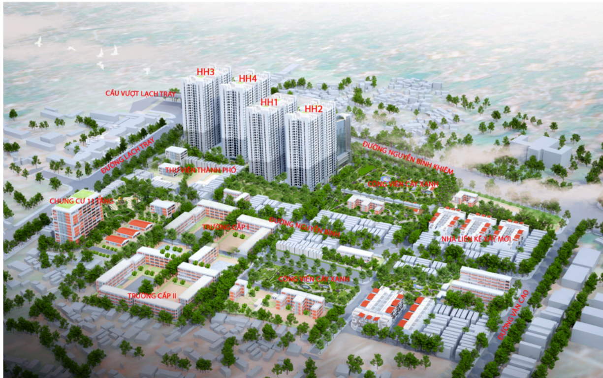
Quy hoạch khu vực Đồng Quốc Bình, Quận Ngô Quyền, Hải Phòng