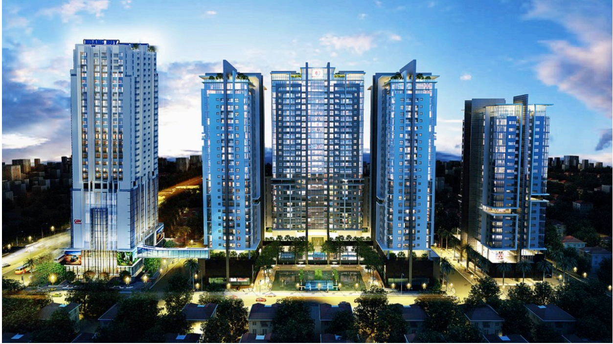
Phối cảnh toà nhà 33 tầng (vị trí ngoài cùng bên tay trái)

Đây là toà nhà có vị trí đặc địa, đẹp nhất của dự án bởi nằm ngay mặt đường lớn Nguyễn Trãi, Quận Thanh Xuân